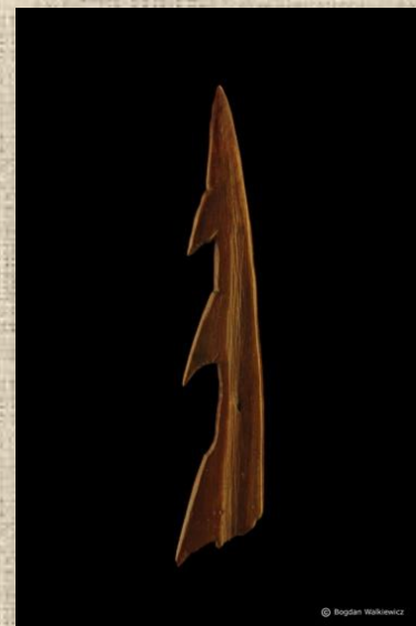
Kościany harpun z zadziorami. Biskupin, pow. Żnin, wystawa: Pradzieje Wielkopolski

Informacje o tym co jedli ludzie w dawnych czasach czerpiemy ze znalezionych artefaktów. Najlepiej zachowują się narzędzia krzemienne i kamienne oraz gliniane naczynia. Z czasów średniowiecznych pochodzą np. żelazne haczyki i elementy sieci do połowu ryb, czy kamienne żarna do mielenia ziarna na mąkę.