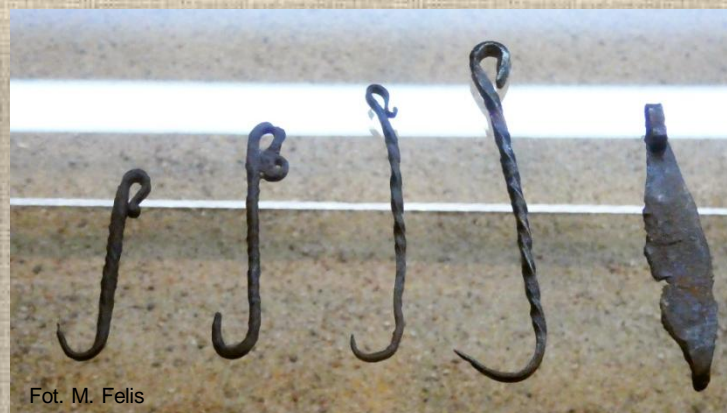
Średniowieczne haczyki na ryby

Wystawa „Tu powstała Polska”, Muzeum Archeologiczne w Poznaniu